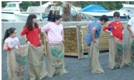
Múltiples juegos en la playa de Puerto Espíndola

Los alumnos se examinan al final de cada actividad. Cada día se les evalúa con el objetivo de valorar su aprendizaje mientras ellos intentan lograr puntos para la clasificación final mediante la cual se accede a importantes premios.