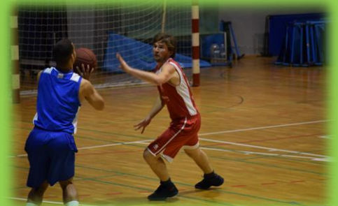
El fichaje de Bram, todo un acierto. Es pieza clave.