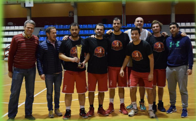
La mala suerte se cebó con el equipo en esta Copa.

El senior tuvo durante casi todo el partido la Copa en sus manos pero finalmente el Aridane le daba la vuelta al partido y les arrebató el título. Tercera final copera perdida por el equipo de manera consecutiva.