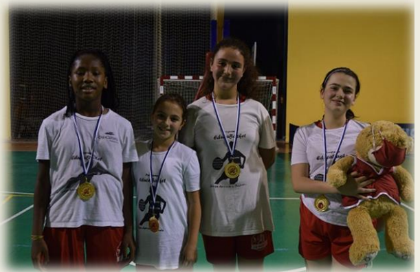
Las Papi Noel y Portland de Belén, triunfaron.

En la categoría Sub´12 "Las Papi Noel" fueron las mejores y resultaron campeonas en una final igualdad ante el "Reno´s Team". En la categoría sub`15, el dominio del "Portland de Belén" fue claro, al terminar invicto la competición, si bien es cierto que en la final venció a los "Tres Reyes Magos" en la ronda de desempate del tiro libre. Otros equipos que merecen una mención especial fueron "Aroa y sus pastorcillos", "Hacia Belén va Fabiola", "La Navidad de las Mascarillas" y "Cuidado con el Grinch".