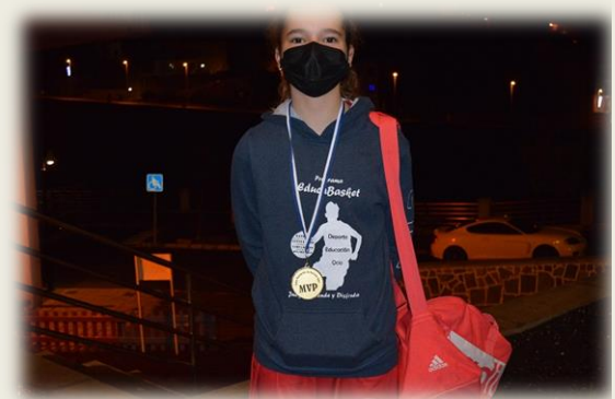
Julia fue de largo la mejor del torneo. Imparable para sus rivales.