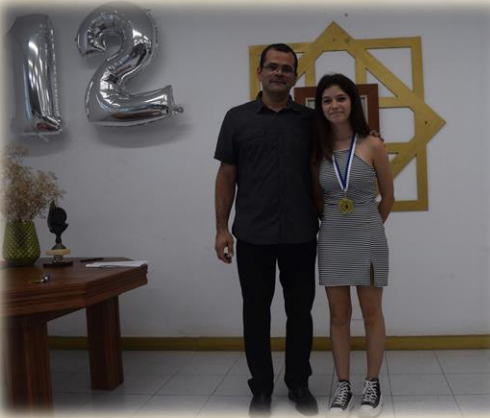
Los galardonados recogieron sus merecidos premios en la Gala.